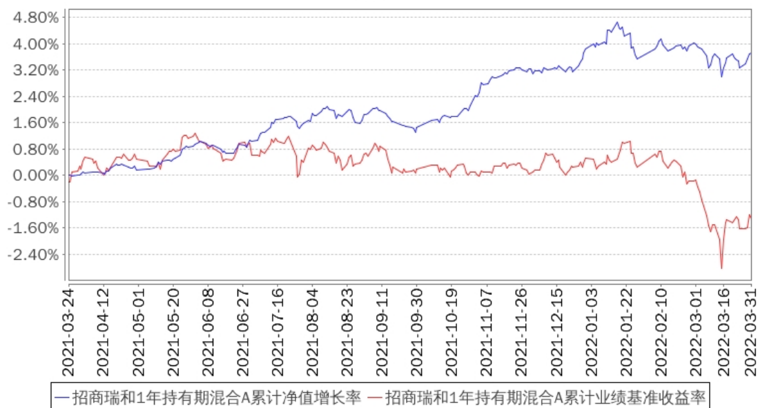
招商瑞和1年持有期混合A累计净值增长率与同期业绩比较基准收益率的历史走势对比图