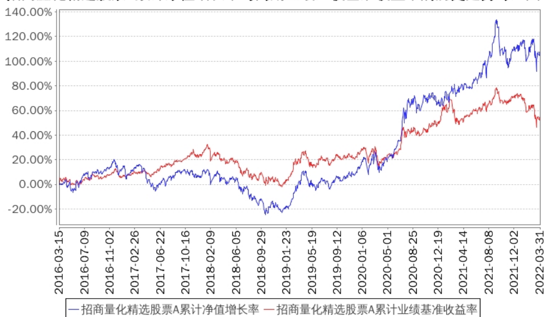
招商量化精选股票A累计净值增长率与同期业绩比较基准收益率的历史走势对比图