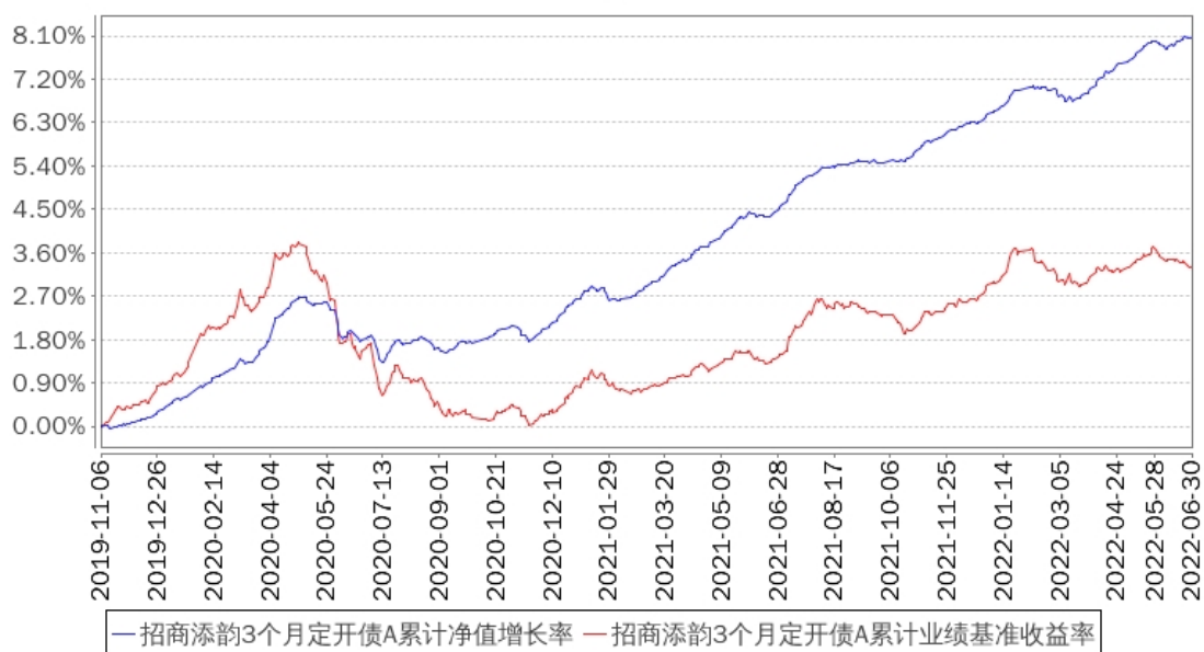
招商添韵3个月定开债A累计净值增长率与同期业绩比较基准收益率的历史走势对比图