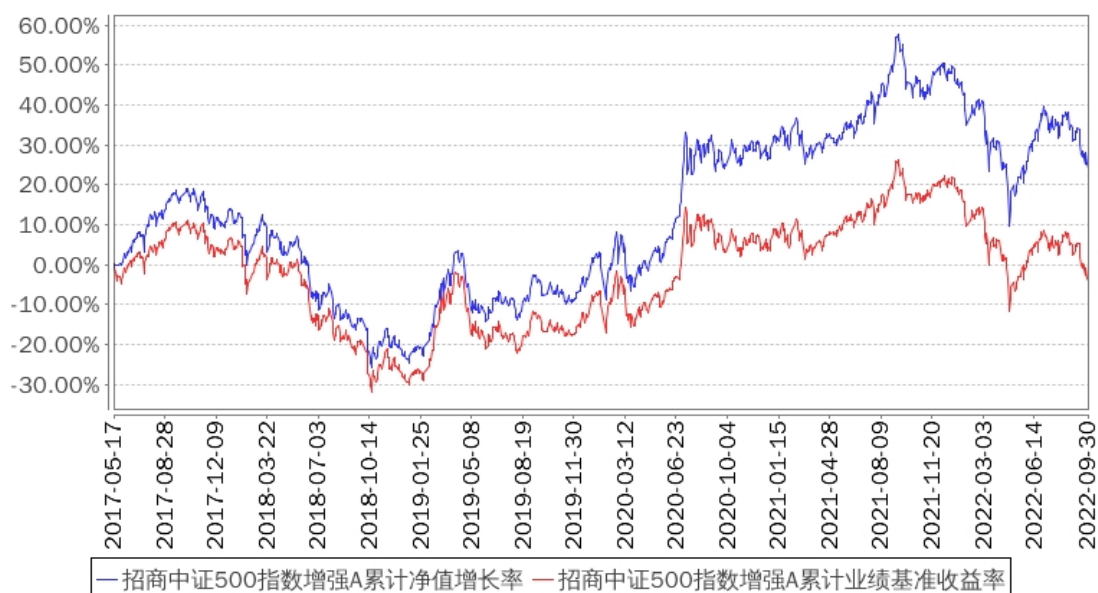
招商中证500指数增强A累计净值增长率与同期业绩比较基准收益率的历史走势对比图