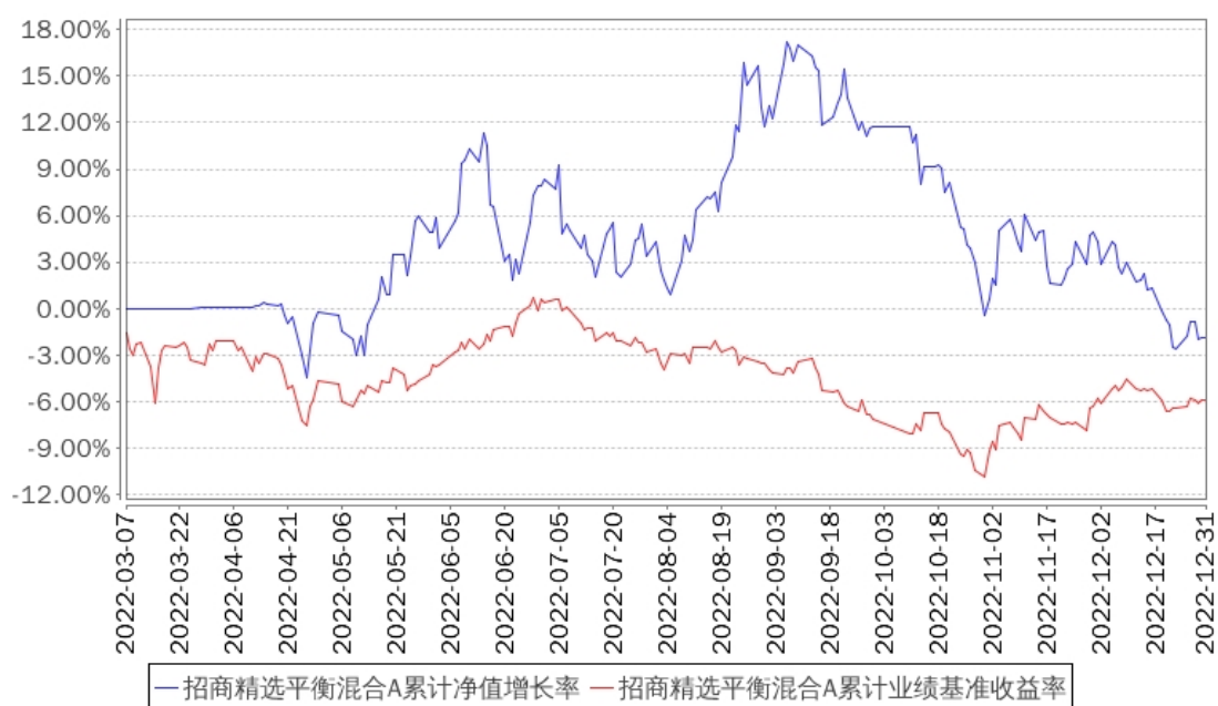
招商精选平衡混合A累计净值增长率与同期业绩比较基准收益率的历史走势对比图