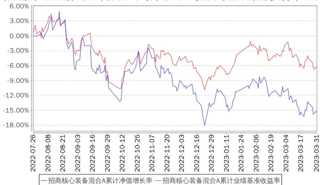
招商核心装备混合A累计净值增长率与同期业绩比较基准收益率的历史走势对比图