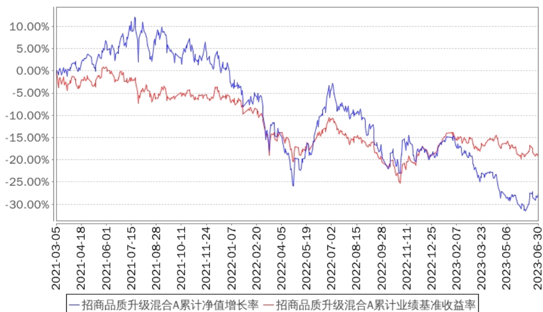
招商品质升级混合A累计净值增长率与同期业绩比较基准收益率的历史走势对比图