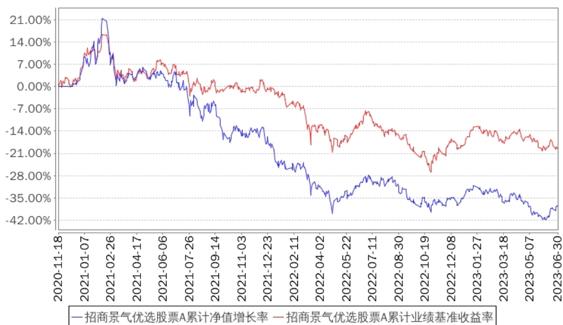
招商景气优选股票A累计净值增长率与同期业绩比较基准收益率的历史走势对比图