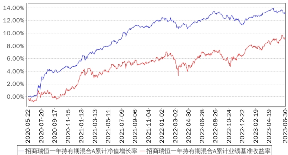
招商瑞恒一年持有期混合A累计净值增长率与同期业绩比较基准收益率的历史走势对比图