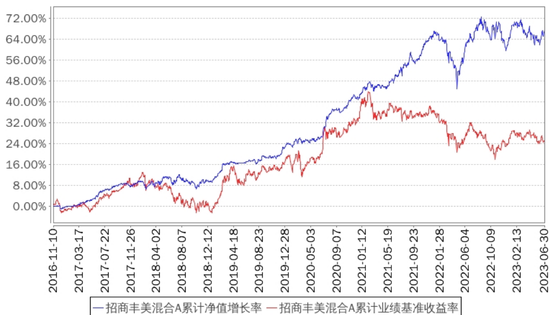
招商丰美混合A累计净值增长率与同期业绩比较基准收益率的历史走势对比图