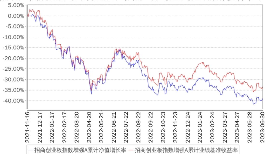
招商创业板指数增强A累计净值增长率与同期业绩比较基准收益率的历史走势对比图