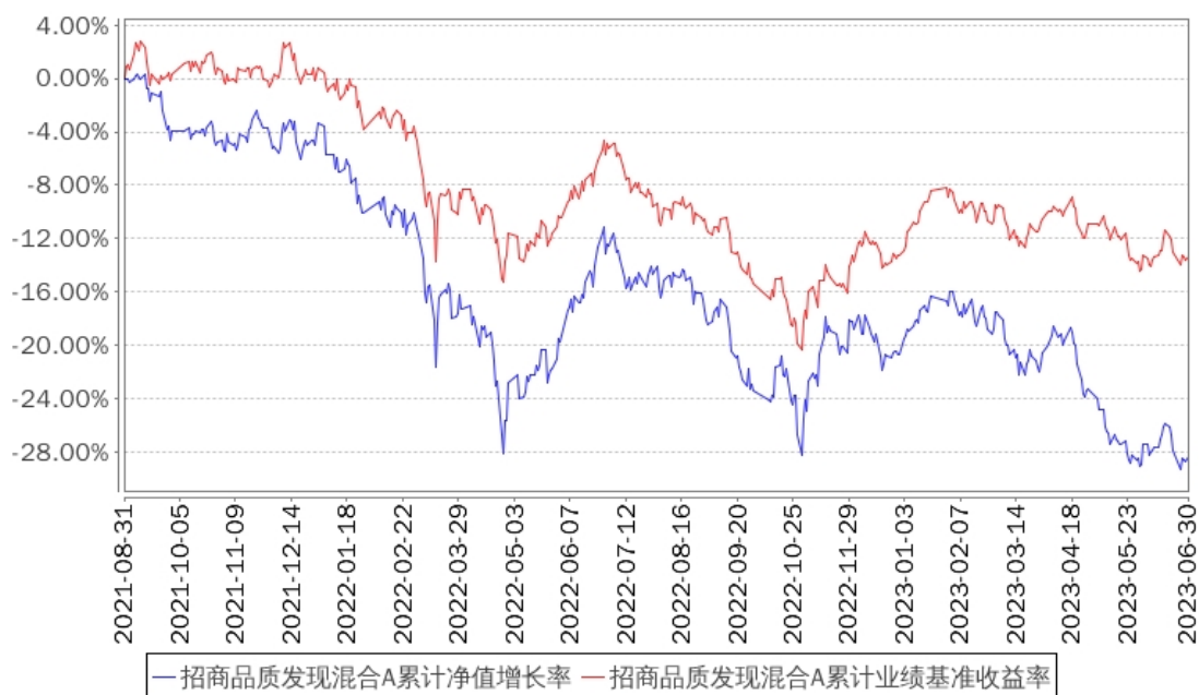
招商品质发现混合A累计净值增长率与同期业绩比较基准收益率的历史走势对比图