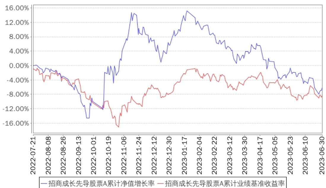
招商成长先导股票A累计净值增长率与同期业绩比较基准收益率的历史走势对比图