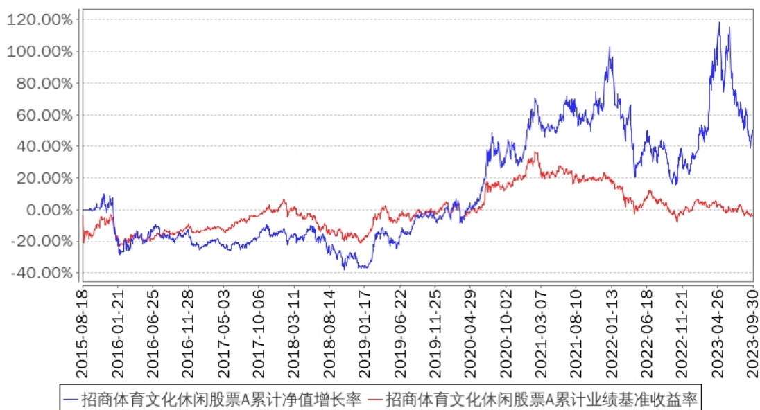
招商体育文化休闲股票A累计净值增长率与同期业绩比较基准收益率的历史走势对比图