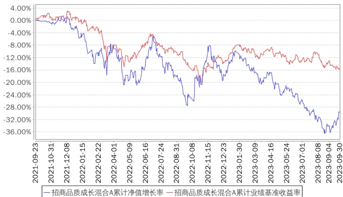
招商品质成长混合A累计净值增长率与同期业绩比较基准收益率的历史走势对比图