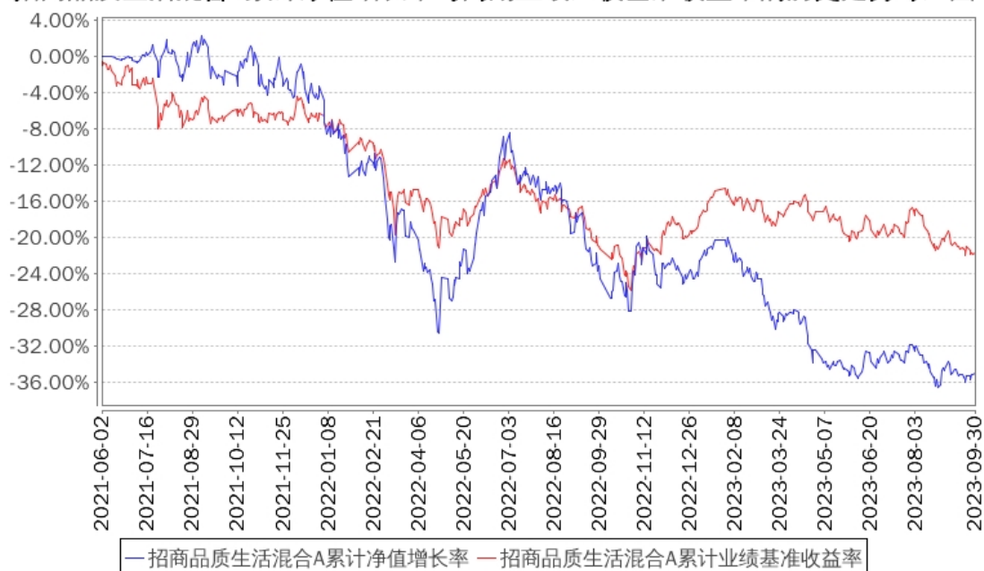
招商品质生活混合A累计净值增长率与同期业绩比较基准收益率的历史走势对比图