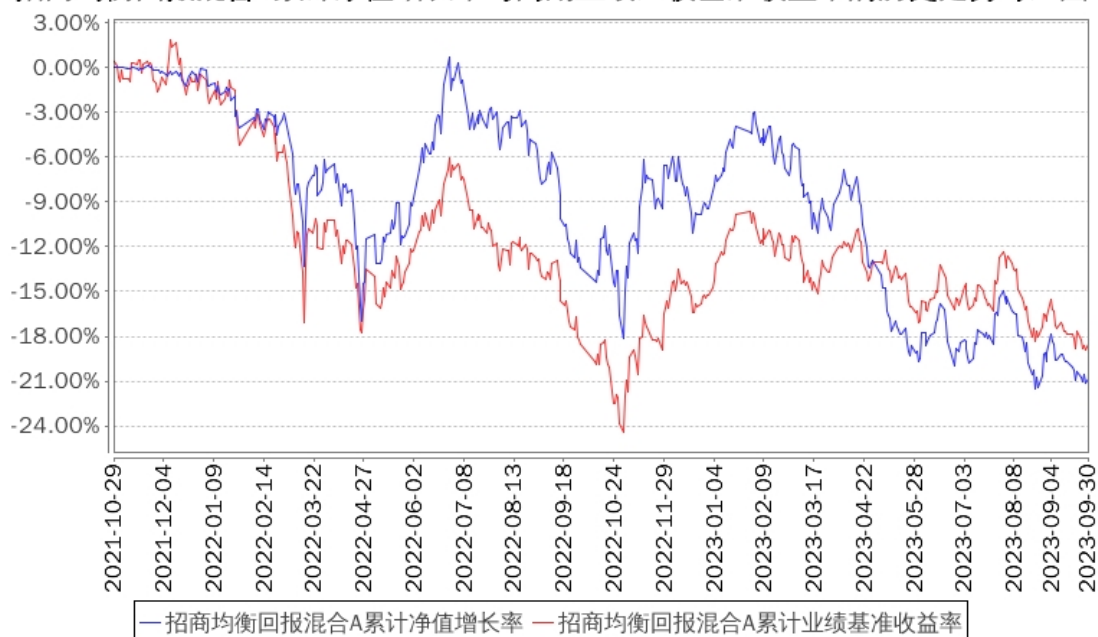
招商均衡回报混合A累计净值增长率与同期业绩比较基准收益率的历史走势对比图