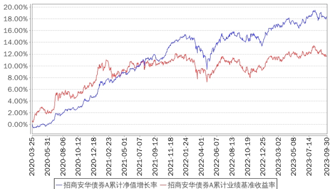
招商安华债券A累计净值增长率与同期业绩比较基准收益率的历史走势对比图