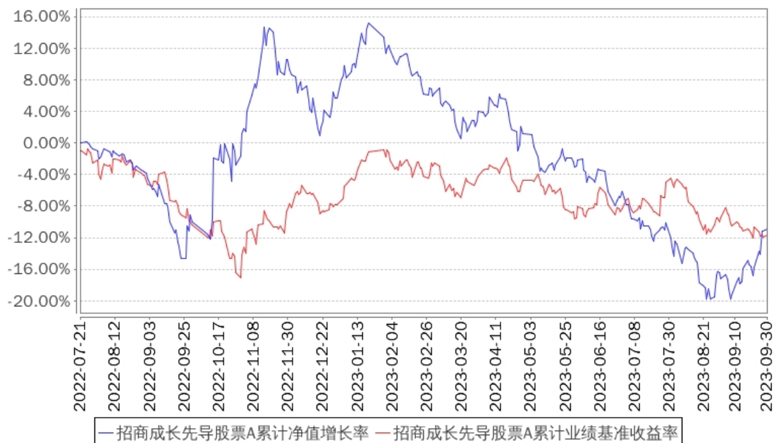
招商成长先导股票A累计净值增长率与同期业绩比较基准收益率的历史走势对比图