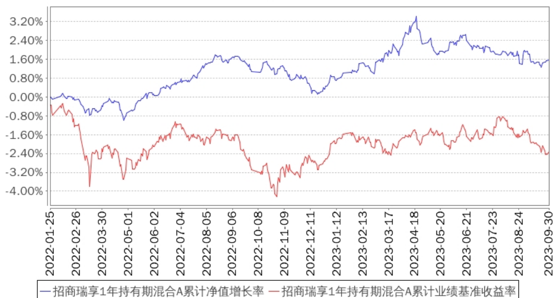
招商瑞享1年持有期混合A累计净值增长率与同期业绩比较基准收益率的历史走势对比图