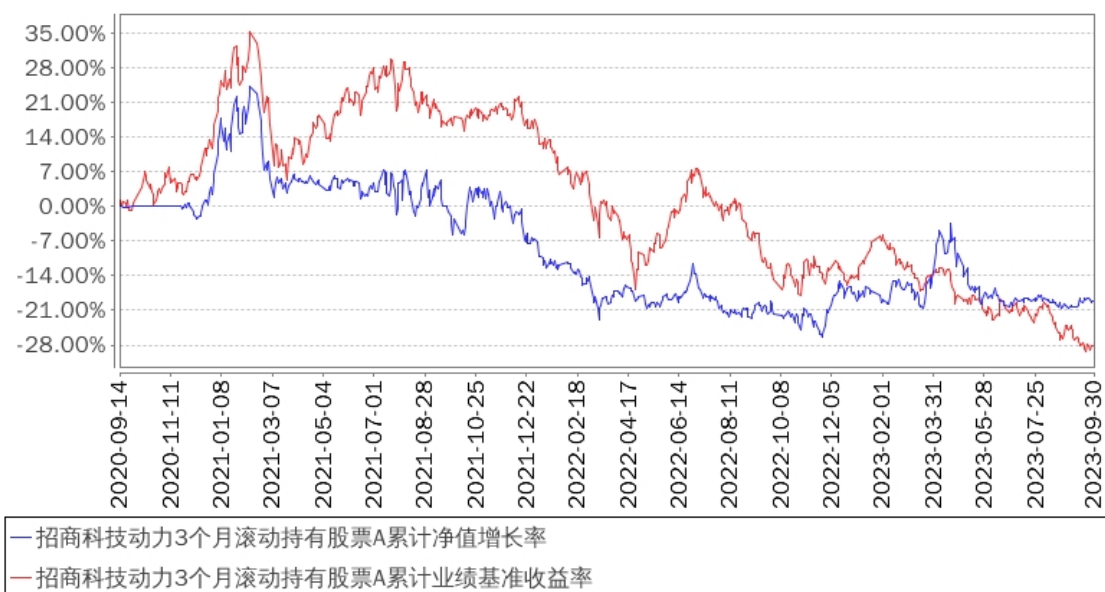
招商科技动力3个月滚动持有股票A累计净值增长率与同期业绩比较基准收益率的历史走势对比图