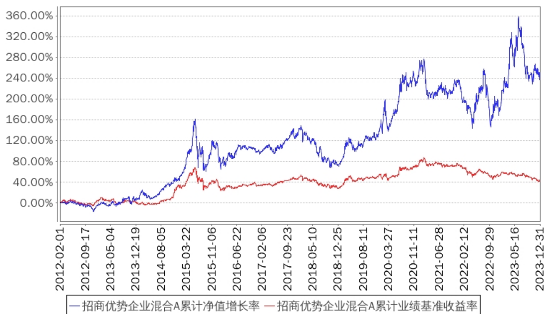
招商优势企业混合A累计净值增长率与同期业绩比较基准收益率的历史走势对比图