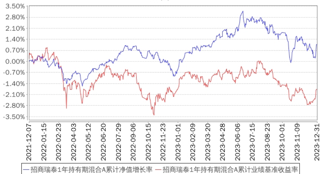
招商瑞泰1年持有期混合A累计净值增长率与同期业绩比较基准收益率的历史走势对比图