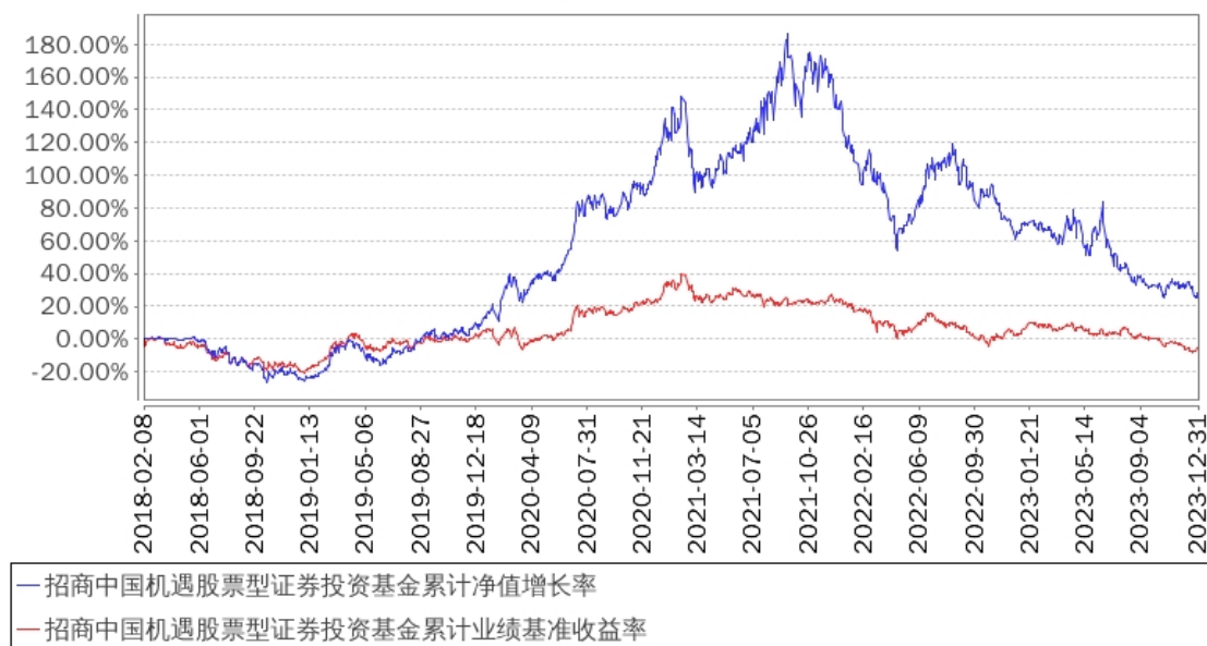
招商中国机遇股票型证券投资基金累计净值增长率与同期业绩比较基准收益率的历史走势对比图