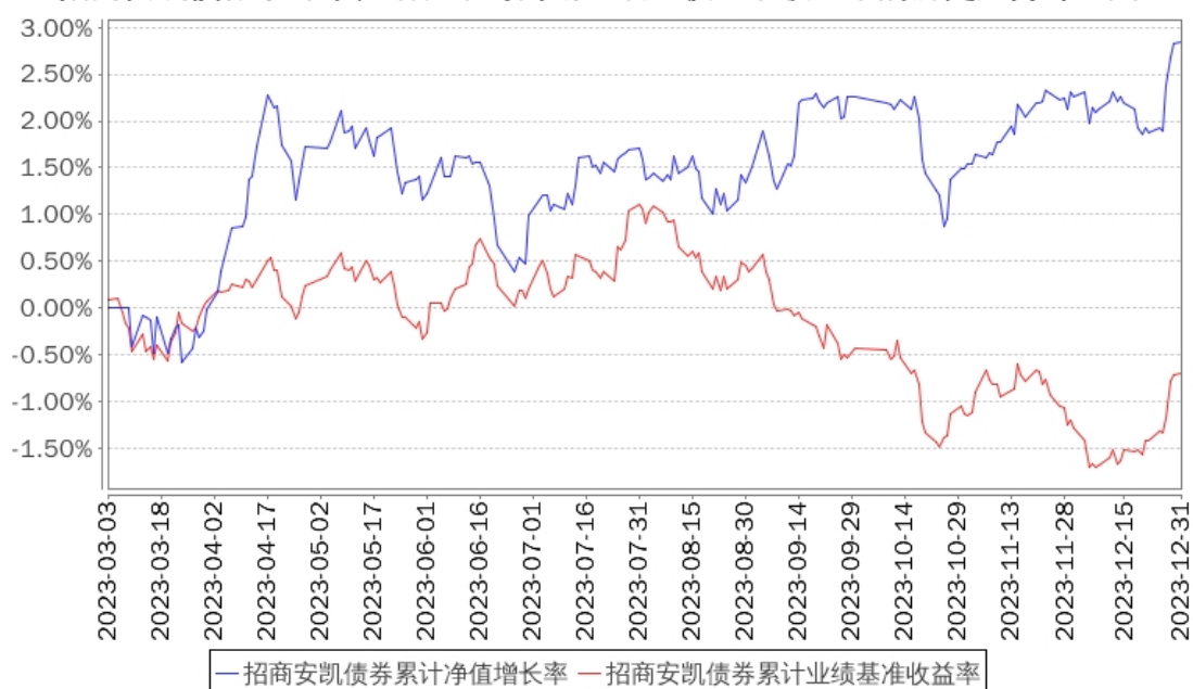
招商安凯债券累计净值增长率与同期业绩比较基准收益率的历史走势对比图