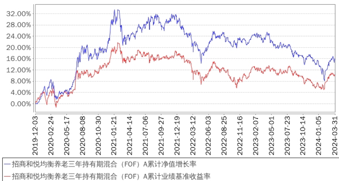
招商和悦均衡养老三年持有期混合（FOF）A累计净值增长率与同期业绩比较基准收益率的历史走势对比图