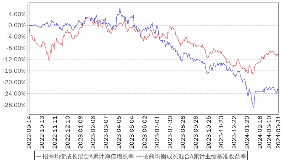
招商均衡成长混合A累计净值增长率与同期业绩比较基准收益率的历史走势对比图