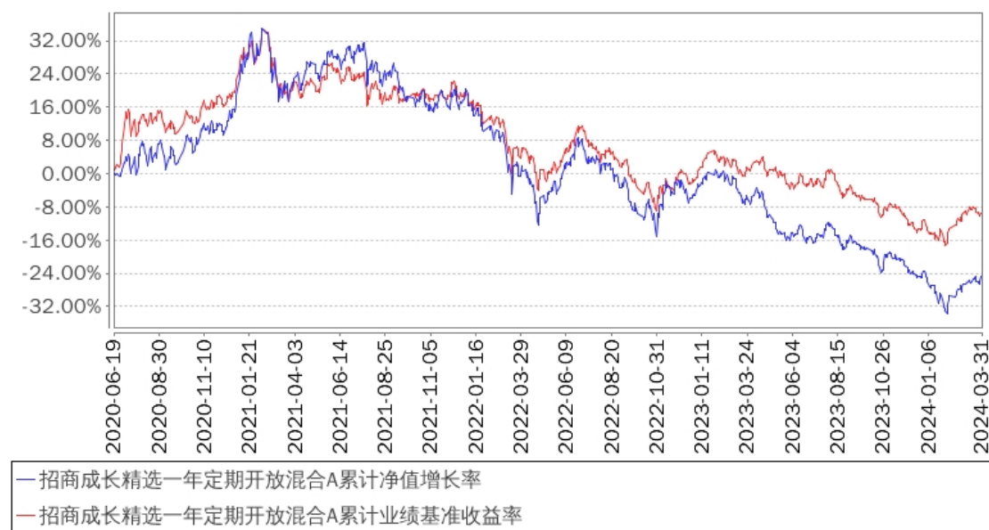
招商成长精选一年定期开放混合A累计净值增长率与同期业绩比较基准收益率的历史走势对比图