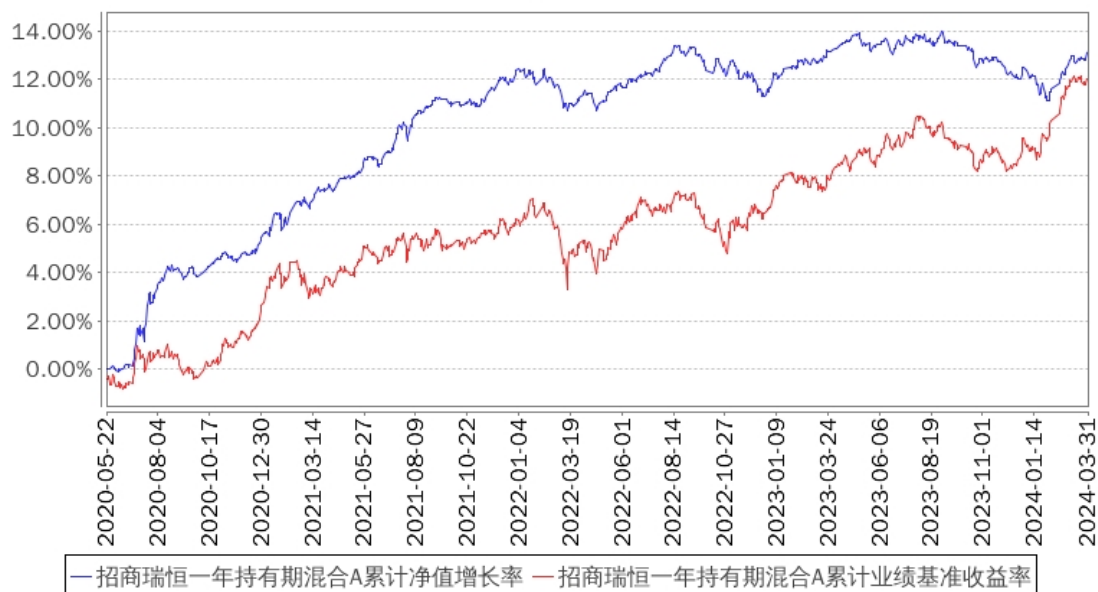
招商瑞恒一年持有期混合A累计净值增长率与同期业绩比较基准收益率的历史走势对比图