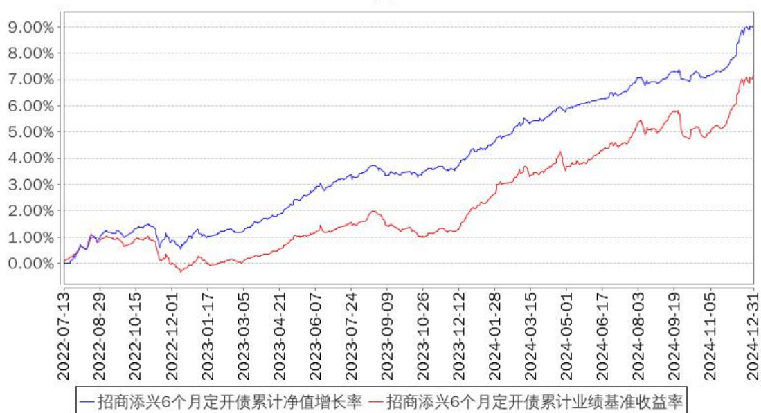
招商添兴6个月定开债累计净值增长率与同期业绩比较基准收益率的历史走势对比图