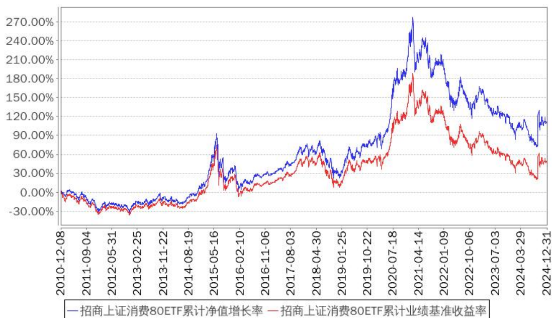
招商上证消费80ETF累计净值增长率与同期业绩比较基准收益率的历史走势对比图