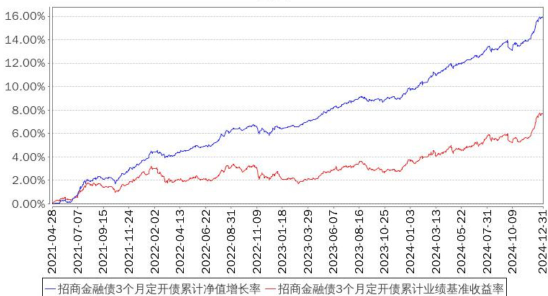
招商金融债3个月定开债累计净值增长率与同期业绩比较基准收益率的历史走势对比图