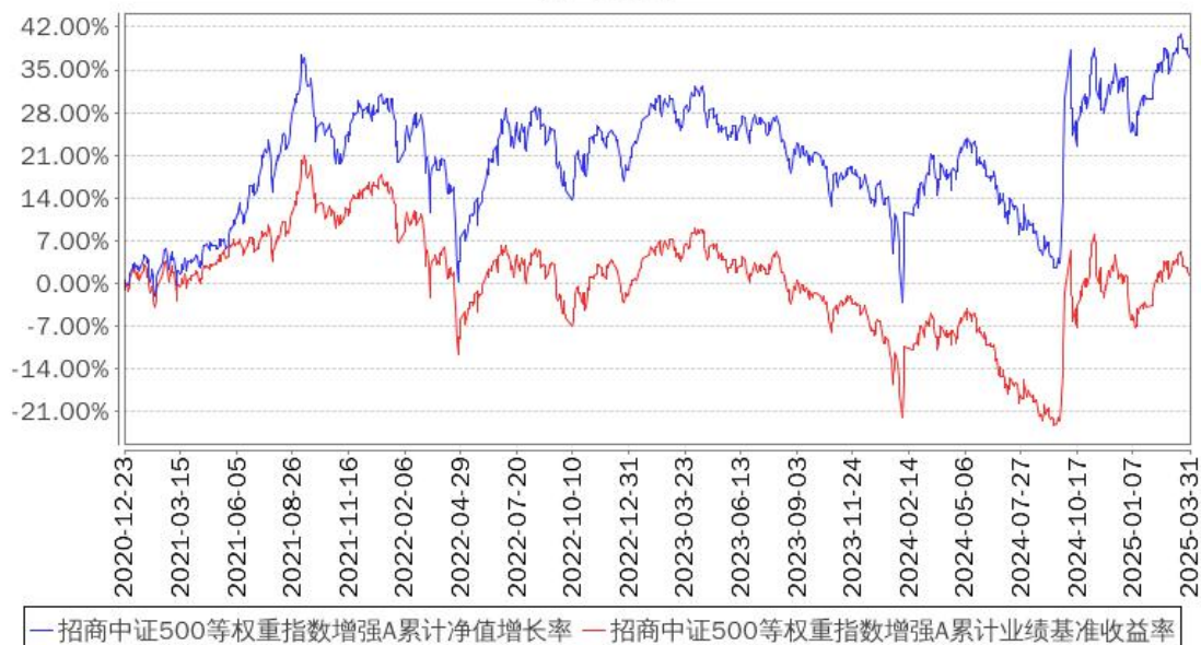
招商中证500等权重指数增强A累计净值增长率与同期业绩比较基准收益率的历史走势对比图